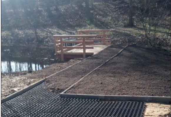
Beispiel Fischteich, St. Michaelisdonn

Zustand von „noch ausreichend“ mit Hilfsmitteln begeh- oder befahrbar, der direkte Zugang zur Plattform ein unebener, aufgeweichter Boden mit erheblicher Querneigung. Sehr gute Erfahrungen haben wir für die Herstellung einer befriedigenden Zuwegung im naturnahen Bereich mit Paddockplatten ohne Unterbau, die bodenschonend verlegt und ohne Versiegelung von Flächen auskommt.