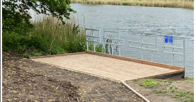
Beispiel Eider in Rendsburg